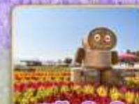
สวนริกีโซโนะโอะกะ