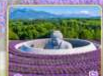
เนินพระนุทธเจ้า